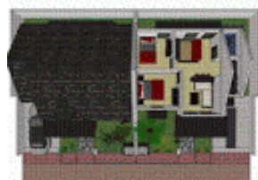
Gambar 3D Dari SketchUp

skala bangunan pada miniatur, serta gambar potongan atau elevasi sebagai pedoman.