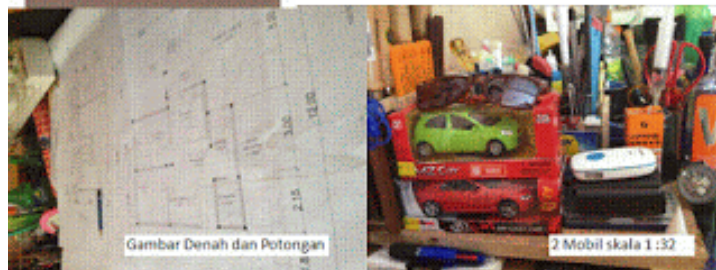
Gambar Denah dan Potongan