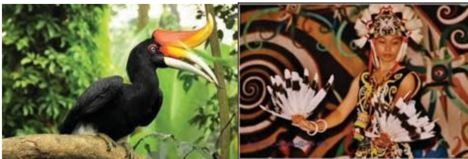
Gambar 1.2 Burung Rangkong (kiri) dan Tari Burung Enggang (kanan)

Sebuah tarian tradisional bisa saja membawakan cerita tradisional, dengan menggunakan pakaian tradisional dan ditarikan pada sebuah upacara yang merupakan ritual tradisional. Contohnya tarian Burung Enggang dari suku Dayak, menceritakan tentang seekor burung enggang. Burung enggang bagi masyarakat Dayak merupakan simbol dewata. Burung enggang merupakan wujud nenek moyang yang turun ke bumi. Penari Burung Enggang menggunakan pakaian tradisional Dayak, dan diiringi musik tradisional yang dimainkan dengan alat musik tradisional. Tarian, simbol, pakaian, musik dan alat musik tersebut dapat menjadi sumber inspirasi dari pembuatan kerajinan. Tarian, simbol dan musik merupakan produk budaya nonbenda, sedangkan pakaian, perlengkapan tari dan alat musik merupakan artifak/objek budaya.