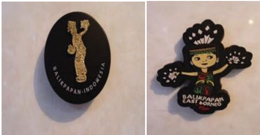
Gambar 1.3 Hiasan kulkas dengan inspirasi Tari Burung Enggang