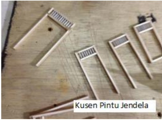
Kusen Pintu Jendela